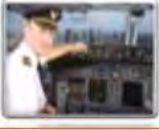
Un pilote طيار